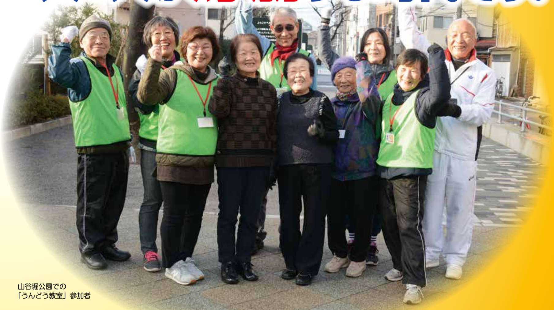
山谷堀公園での「うんどう教室」参加者