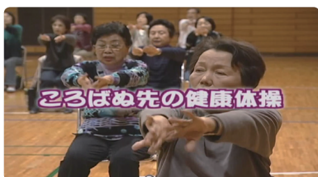
● やってみよう! ころばぬ先の健康体操