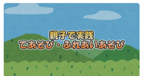
● 親子で実践! てあそび・ふれあいあそび