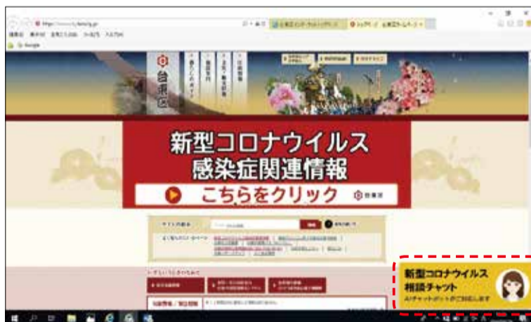
〈区HPトップの右下をクリック〉