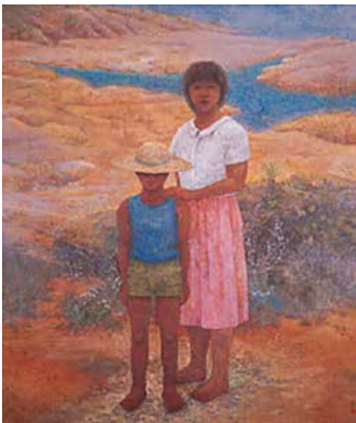
▲昭和61年度台東区長賞受賞作品(日本画)「夏の終わりに」 仲裕行

「台東区ヴァーチャル美術館」は、区が所蔵する「台東区長賞」・「台東区長奨励賞」受賞作品や東京藝術大学大学院の修了制作の一部として制作された「敦煌莫高窟壁画」の模写作品、書道博物館の所蔵品などを紹介するウェブサイトです。作品の画像や作者の紹介などを掲載しています。※下記二次元コードからご覧ください。 問合せ 文化振興課 TEL (5246) 1153