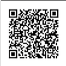
平成7年度台東区長賞 受賞作品(日本画) 「記憶風景」熊川みのり