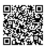
▲ワクチンに関する新着情報

※3月31日時点の情報に基づき作成しています。接種会場等は変更となる場合がありますので、詳しくは区HPをご確認ください。