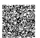
▲小児接種について

※3月31日時点の情報に基づき作成しています。接種会場等は変更となる場合がありますので、詳しくは区HPをご確認ください。