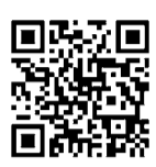
▲台東区ヴァーチャル美術館