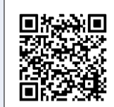
▲音楽分野の詳細はこちら