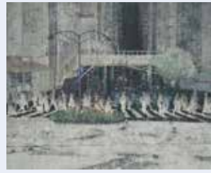
▲美術分野 原澤亨輔「幻想」(日本画)