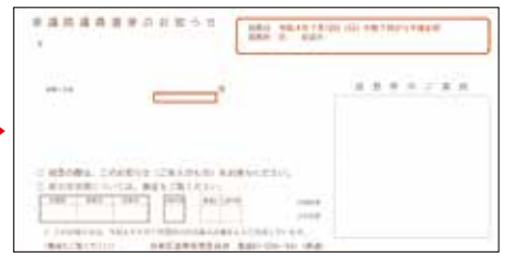
▲ご自身の「選挙のお知らせ」