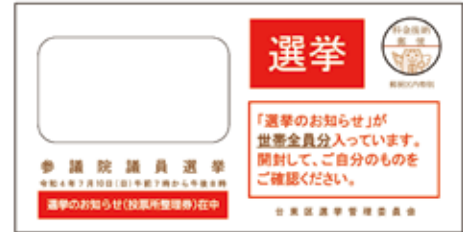
▲「選挙のお知らせ」の封筒