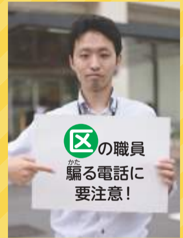
撮影協力: 区内の防犯活動に携わる方々