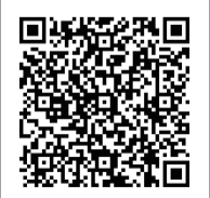
▲接種証明書(ワクチンパスポート)について

※海外用の接種証明書を取得するためには、7月21日以降アプリで海外用の接種証明書を取得している、または台東保健所での申請が必要です。