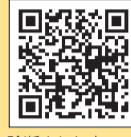
陽性と診断された方へ▲