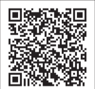
▲接種券の発行申請について(4回目接種用)