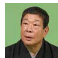
▲柳家さん喬(落語家)