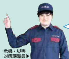
危機・災害対策課職員

避難情報が発令された場合でも、 在宅避難 (2階以上への避難) をしてください。