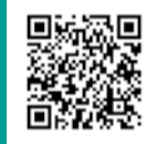
台東区内水氾濫ハザードマップ