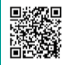
台東区防災アプリ「台東防災」