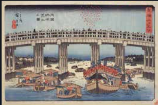
一立斎広重(歌川広重)「両国納涼花火之圖」

江戸時代の享保17(1732)年に大飢饉が発生し、多くの餓死者が出たうえに、疫病まで流行したことで、国勢に多大な被害と影響を与えました。犠牲となった人々の慰霊と悪疫退散を祈って、幕府(8代將軍吉宗)が催した水神祭に続き、享保18(1733)年に両国橋周辺の料理屋が公許(許可)により花火を上げたことが「両国の川開き」の由来とされています。