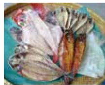
伊豆の海産物(静岡県東伊豆町)

※上記は販売品の一例です。他にもたくさんの特産品を取りそろえています。※画像はイメージです。当日の盛り付け方は異なる場合があります。