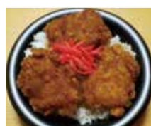
上州とり肉のソースカツ丼(群馬県みどり市)