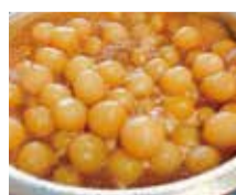
玉こんにゃく(山形県村山市)

●その他 今年に関東大震災から100年の節目。震災当時の市街地の写真や資料と合わせ、東日本大震災により甚大な被害を受けた宮城県大崎市(姉妹都市)の記録写真を展示します。