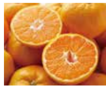
みかん(福岡県八女市)