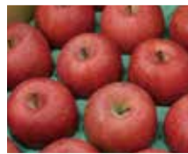
信州・諏訪産りんご(長野県諏訪市)