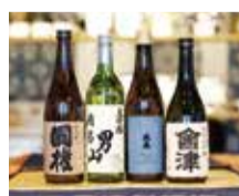
南会津4蔵の地酒(福島県南会津町)