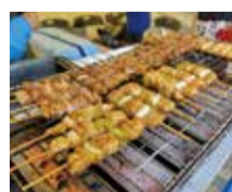
栃木しゃもの串焼き(栃木県鹿沼市)