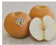
恵水梨(茨城県筑西市)