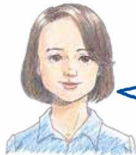
カウンセラーより

ご自身の生き方、家族、学校・職場の人間関係、子育てやご家庭の悩み、性自認など誰にでも悩みはあります。 こころと生きかたなんでも相談 では、第三者の立場からカウンセラーが悩みをお聴きし、一緒に考えていきます。どんな悩みでもかまいません。お気軽にご相談ください。