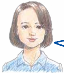
カウンセラーより

ご自身の生き方、家族、学校・職場の人間関係、子育てやご家庭の悩み、性自認など誰にでも悩みはあります。 こころと生きかたなんでも相談 では、第三者の立場からカウンセラーが悩みをお聴きし、一緒に考えていきます。どんな悩みでもかまいません。お気軽にご相談ください。