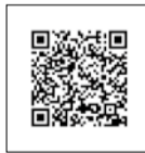
滞在地投票申請についてはこちら

「選挙のお知らせ」裏面の「投票用紙等請求書」に必要事項を記入し、台東区選挙管理委員会に郵送(電子申請可)。 ※電子申請の場合はマイナンバーカードをご用意ください。