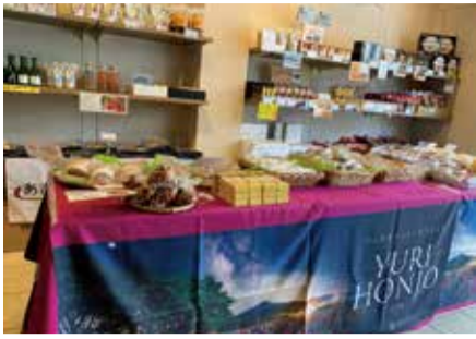
過去のショップの様子(秋田県由利本荘市)

時 10:00~19:00 (水曜日定休) 出店期間・自治体 11月20日(木)~25日(火)・ 静岡県東伊豆町、11月27日(木)~12月2日(火)・ 山形県村山市・宮城県塩竈市、12月4日(木)~9日(火)・ 青森県青森市、12月11日(木)~16日(火)・ 秋田県由利本荘市、12月18日(木)~23日(火)・ 秋田県仙北市 問 ふるさと交流ショップ 台東 TEL (3874) 8827 都市交流課 TEL (5246) 1016