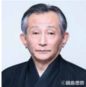
観世清和 (能楽 二十六世観世宗家)