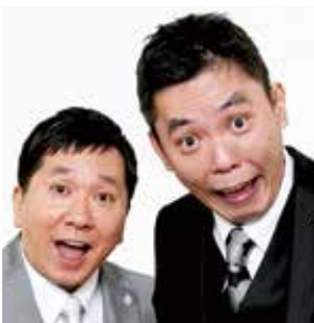
爆笑問題(田中裕二・太田光) (漫才師)