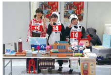
受賞した作品「台東区の歴史」とメンバー