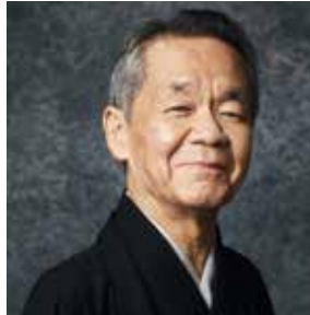
春風亭一朝 (落語家)

3月14日(土)、オレンジ通り沿い花壇に手型台を設置し、浅草公会堂で「スターの手型」顕彰式を行います。