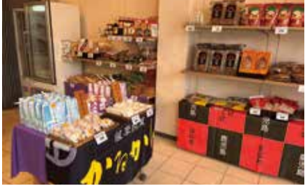
過去の出店の様子(鹿児島県鹿児島市)

時 10:00~19:00(水曜日定休) 出店期間・自治体 2月26日(木)~3月3日(火)・高知県安芸市、3月5日(木)~10日(火)・北海道函館市、3月12日(木)~17日(火)・鹿児島県鹿児島市、3月19日(木)~24日(火)・秋田県にかほ市 問 ふるさと交流ショップ 台東 TEL (3874) 8827 都市交流課 TEL (5246) 1016