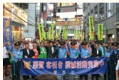
▲客引き行為等防止キャンペーン

区内の路上等公共の場所において、区民等に不安を与え、迷惑をかける客引き行為等を防止するため、「台東区公共の場所における客引き行為等の防止に関する条例」を制定しました。 条例施行後は、地域や警察との連携をさらに強化し、客引き行為等への指導を行っていきます。