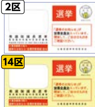
▲「選挙のお知らせ」の封筒

※「選挙のお知らせ」が手元にな くても投票できますので、投票 所の係員にお申し出ください (受付に時間がかかります)。