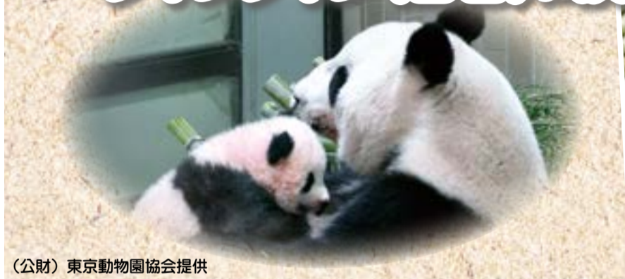
(公財) 東京動物園協会提供