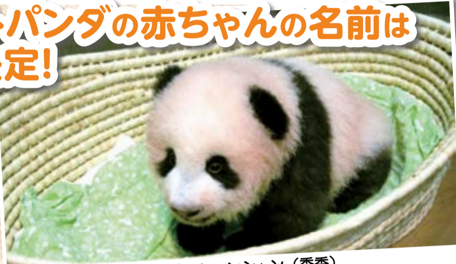
100日齢のシャンシャン(香香)