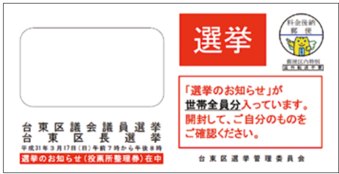
「選挙のお知らせ」の封筒

1. 「選挙のお知らせ」の裏面を記入 「選挙のお知らせ」が届いたら、裏面の「投票用紙等請求書」欄に、自宅などで必要事項を記入してください。