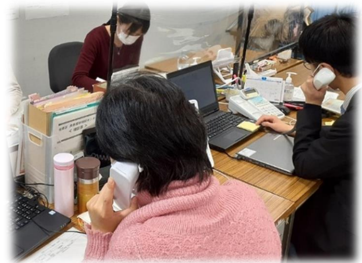
発熱受診相談センター