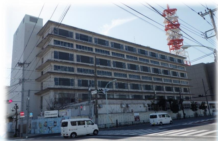
旧東京北部小包集中局跡地