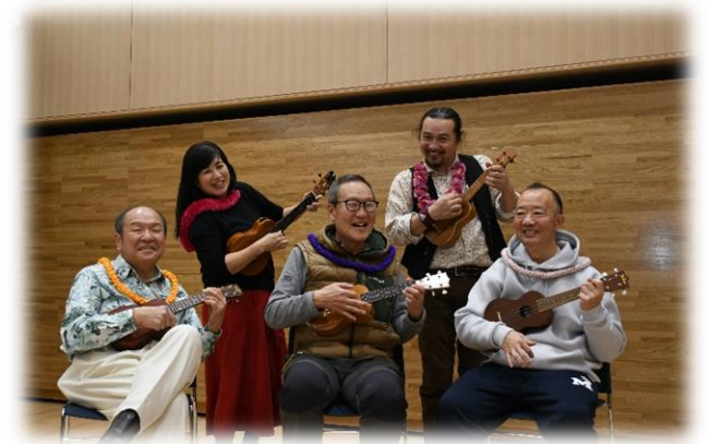
かがやき長寿ひろば入谷(ウクレレ教室)の様子