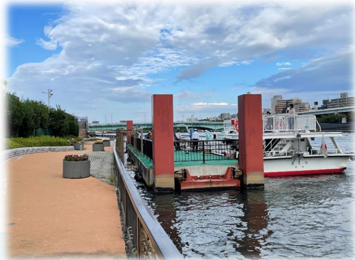
浅草東参道二天門防災船着場