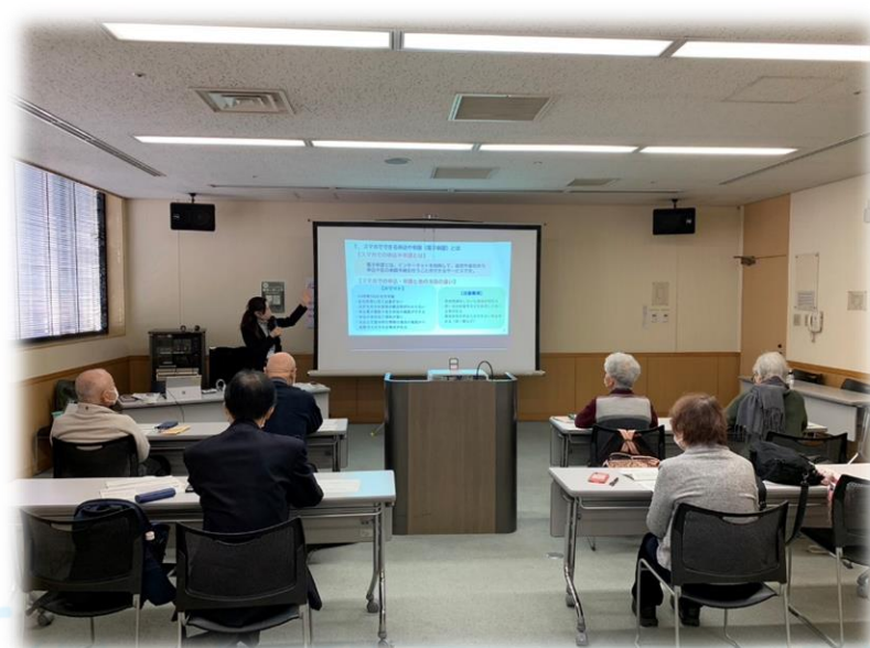
高齢者向け無料スマホ講座