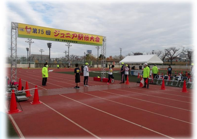
台東リバーサイドスポーツセンター