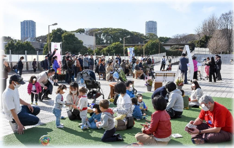
歩行者中心のまちの形成(上野)