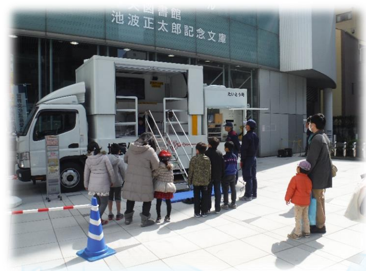
防災フェアの様子