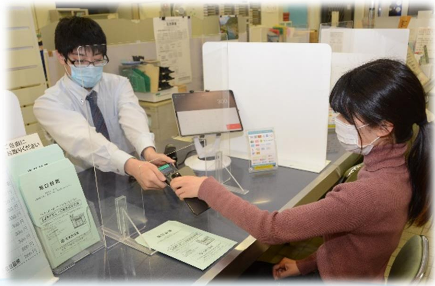
区役所窓口等でのキャッシュレス決済