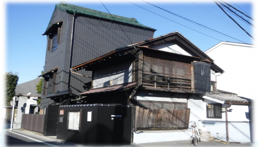
朝倉彫塑館通り(すぺーす小倉屋)