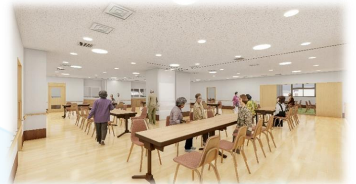
（仮称）竜泉二丁目福祉施設イメージ