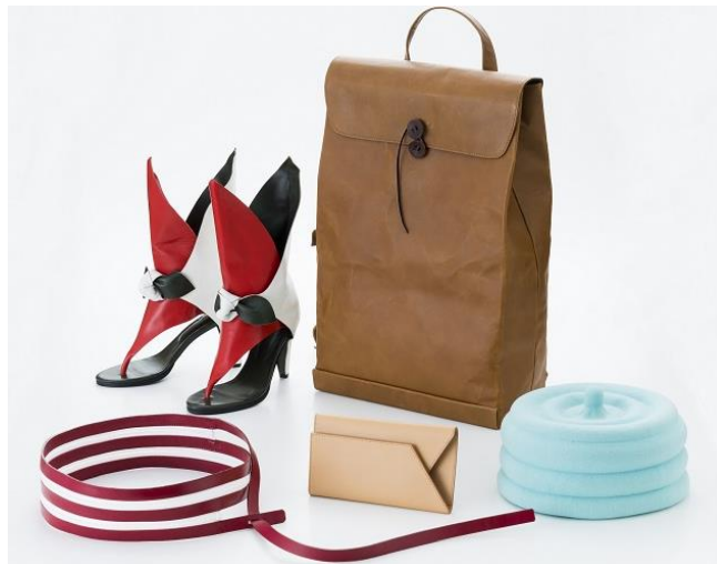
優秀なデザイン画を区内周辺メーカーが製品化しました