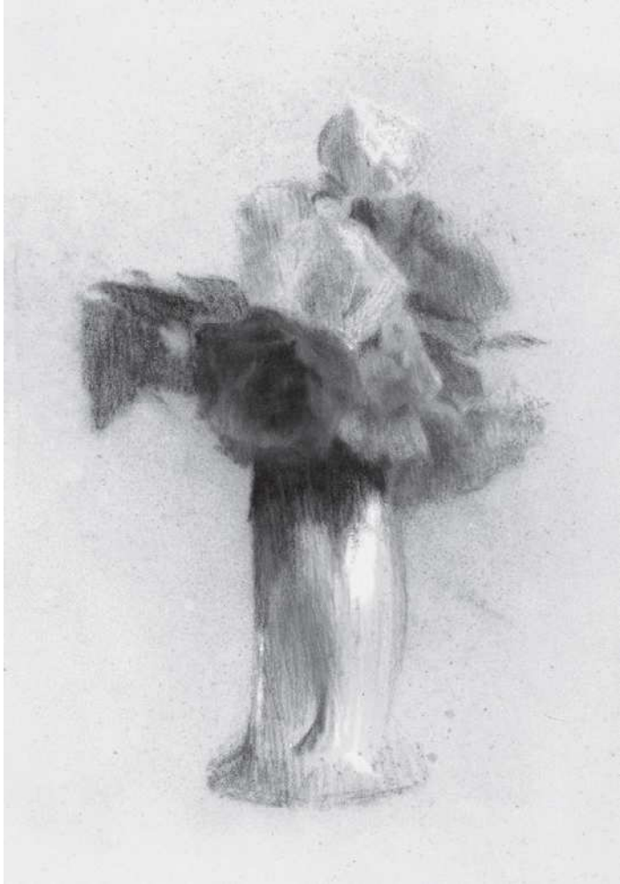
Pastel drawings of a vase with flowers. Presumably, executed during under Karen Blixen's stay in Denmark 1915-16.