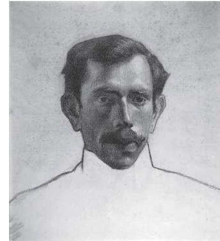
Two portraits from the Danish Royal Academy in Copenhagen, ca. 1905.