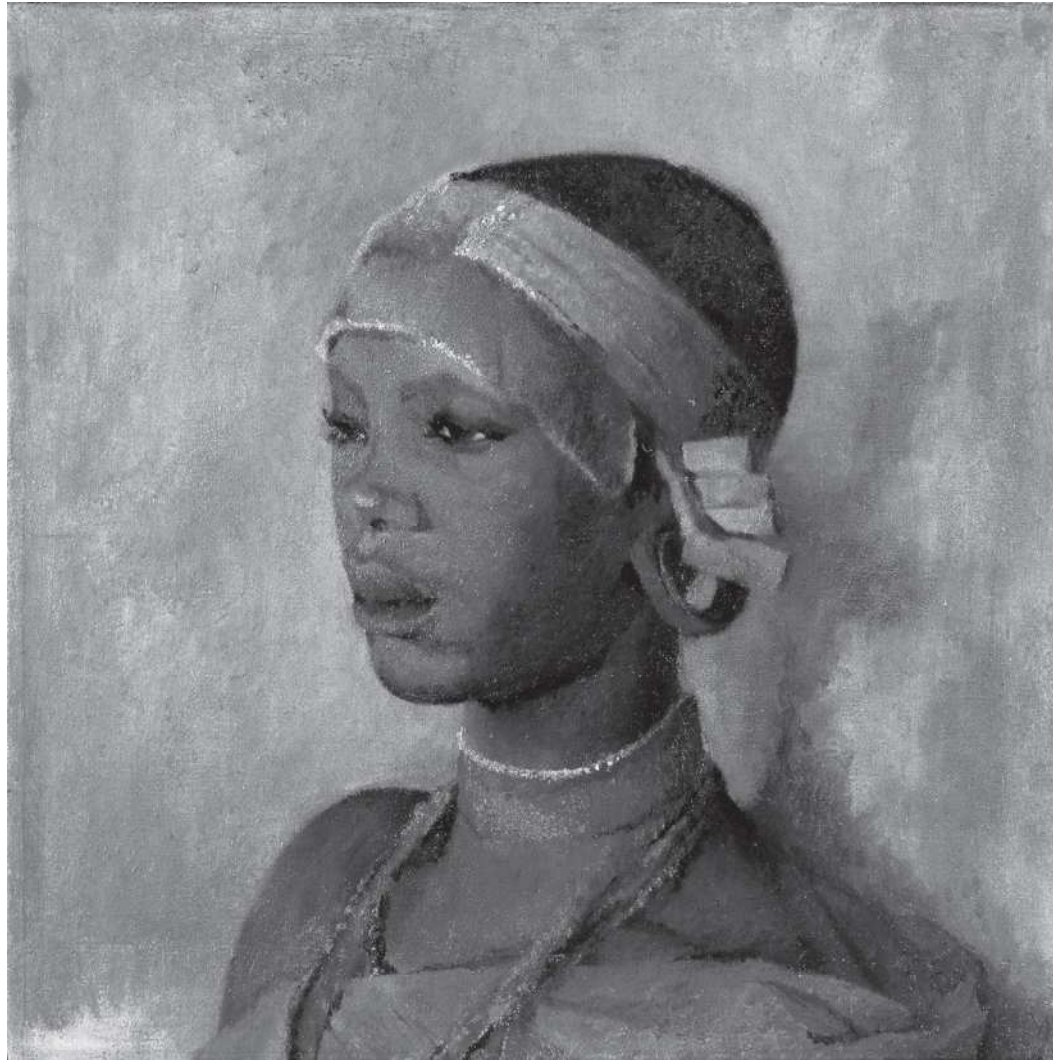
A young Kikuyu girl painted by Karen Blixen ca. 1923.