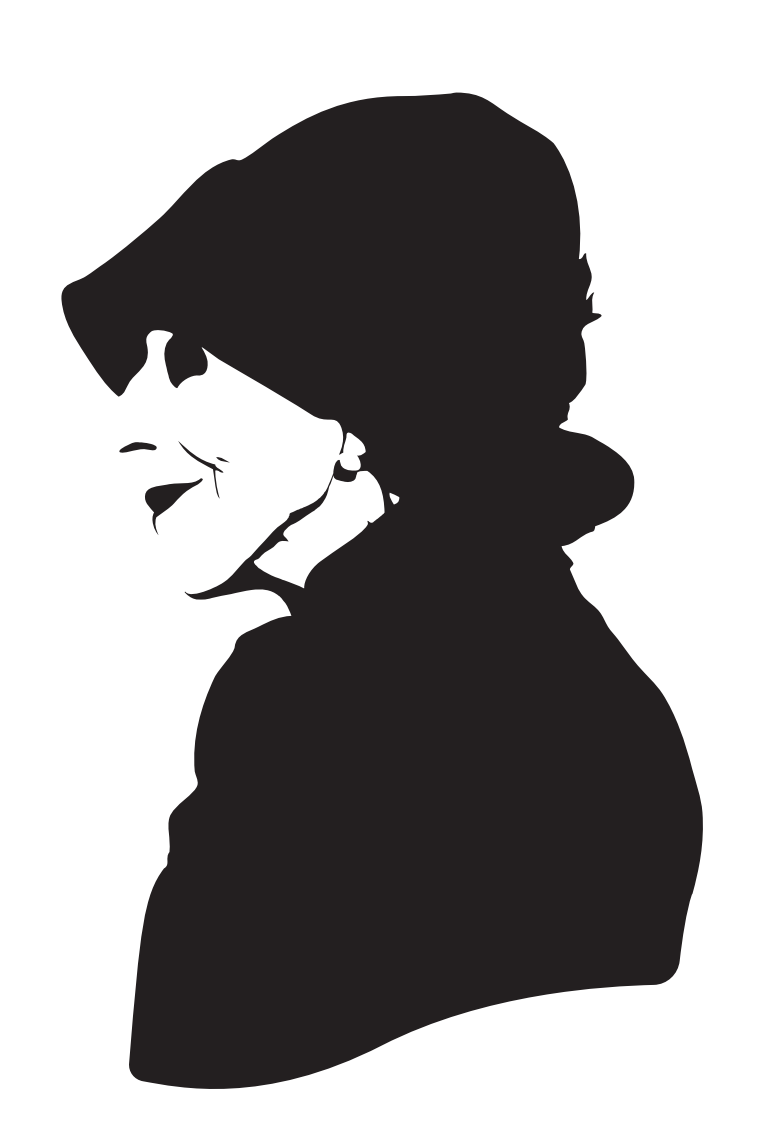
16 I live on at Rungstedlund