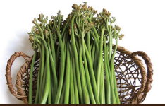
採れたて新鮮生わらび