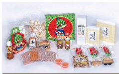
富里市ふるさと産品