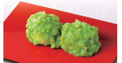
郷土料理「ずんだ餅」