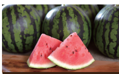
甘くておいしい富里のすいか