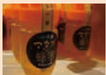
マタギが採った純正蜂蜜