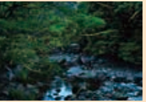
清流白山川で乱舞する虫