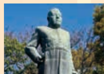
明治維新の立役者 西郷隆盛

鹿児島市は、明治維新の原動力となった西郷隆盛など多くの偉人を輩出した歴史や文化、雄大な桜島や波静かな錦江湾などの自然、豊富な温泉、黒豚・桜島大根・焼酎など多彩な食に恵まれた国際観光都市です。お馴染みのさつまあげ、銘菓かるかんなど、「食の都かごしま」の美味をぜひお楽しみください。