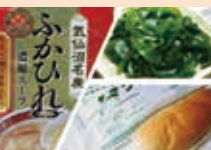
ご家庭でふかひれスープ/三陸生わかめふわふわコッペリのクリームサンド