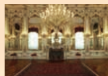
ホーフブルク王宮の部屋

ヨーロッパの中心に位置し、かつて一大帝国を築き上げたオーストリアには、現代においても豊かで多彩な文化が、大都市や小さな地方都市、そしてアルプスの村々にも息づいています。人々のライフスタイルや文化、美味しいフードや雑貨など、色とりどりのオーストリアをご紹介します。