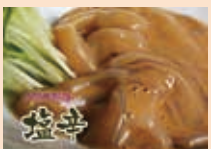
作り手のこだわり イカの塩辛