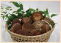
旨みたっぷり「生しいたけ」