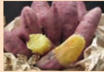
しっとり甘〜い「甘太くん」

豊後大野市は、九州大分県の南西部に位置し、「日本ジオパーク」と「世界ユネスコエコパーク」に認定されている豊かな自然に囲まれたまちです。寒い冬にぴったりの「酒まんじゅう」と「焼き芋」をお持ちします。昨年度すぐに完売した商品ですのでぜひお早めにお越しください。その他にも豊後大野市の特産品を多数取り揃えております。皆様のお越しを心よりお待ちしております。