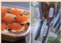
三陸海産物/釜石・干物セット