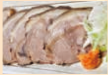
紅茶で蒸込んでやわらかい「紅茶いのしし」