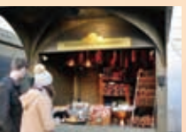
マーケットのソーセージ屋さん