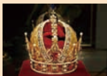
王宮宝物館