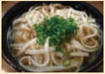
鳥海山の湧水使用「象潟うどん」