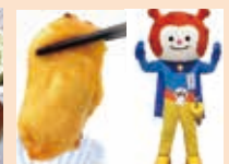
ふりぶろおさしみホヤ/ホヤーヤグッズ