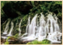
観光名所「元滝伏流水」