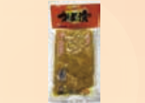
鹿児島のお漬物・つば漬け