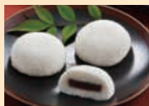
自然薯を使った郷土菓子・かるかん