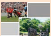
釜石シューエイブス/「橋野鉄鉱山」