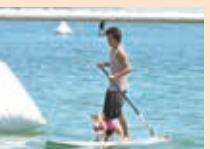
住みたくなる街「おつち」移住定住相談