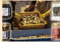
ハタハタを美味しく料理しました

にかほ市は秋田県南西部に位置し、鳥海山と日本海に抱かれた風光明媚なまちです。出羽富士とも呼ばれる美しい山からの豊富な水源を活かした農作物や、四季折々の日本海からの恵みを活かした水産物、また米どころ秋田ならではの米を活かした地酒等、にかほ市を堪能できる特産品をご用意しております。