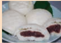
ふっくらほかほか「酒まんじゅう」