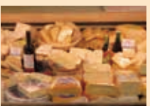
チーズ屋さん