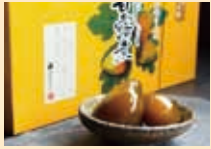
北限のイチジク 甘露煮は大人気