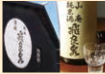
東北最古の酒蔵「飛鳥泉」の地酒