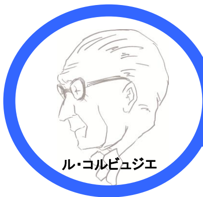
ル・コルビュジエ