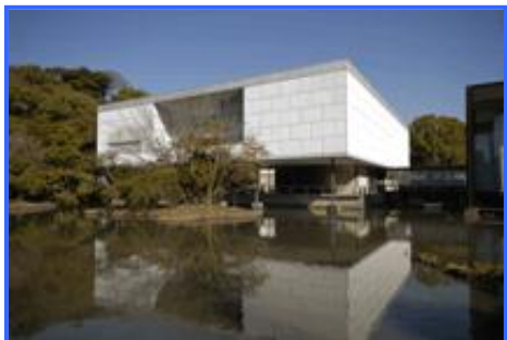
神奈川県立近代美術館

1927年(昭和2年)東京帝国大学文学部美学美術史学科卒業後、1929年(昭和4年)渡仏し、パリ大学で建築を学んだのち、1931年、帰国した前川と入れ替わるように、ル・コルビュジエのアトリエに入所した。その後、5年間アトリエに滞在し、その間、ソヴィエト・パレス、輝ける住宅などに携わる。帰国後、再渡仏し、1937年パリ万国博覧会の日本館パビリオンの設計を担当し、博覧会の建築競技審査でグランプリを受賞した。代表的な作品として、神奈川県立近代美術館(1951年)、国際文化会館、新宿駅西口広場(1966年)などがある。