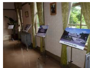
奏楽堂でのパネル展示の様子

7月3日（土）、奏楽堂にて世界遺産応援コンサート「奏楽堂 de フランス音楽物語Ⅲ」が開催されました。当日、台東区芸術文化財団の協力により、来場者に啓発用パンフレットが配付されました。また、奏楽堂2階の展示スペースを活用して、国立西洋美術館のパネル展示も行いました。