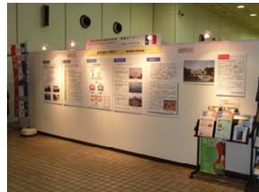
区役所1階情報コーナー