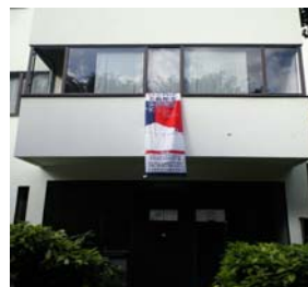
ラ・ロッシュ＝ジャンヌレ邸