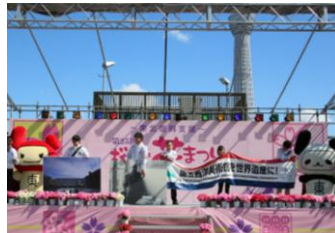
桜橋花まつりの様子②