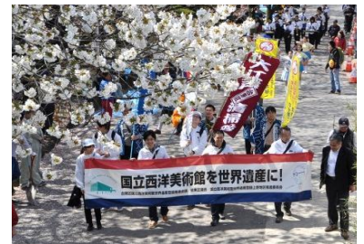
桜橋花まつりの様子

両イベントとも来場された方々にパンフレットや啓発用のメモ帳、シール等を配布し、多くの方へご理解とご支援をお願いしました。今後も各種イベント等に参加し、積極的にPR活動を実施して参ります。