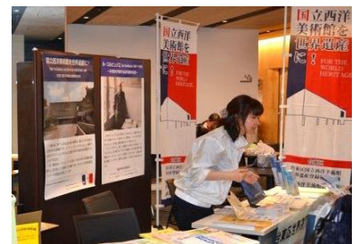
浅草橋紅白マロニエまつりの様子